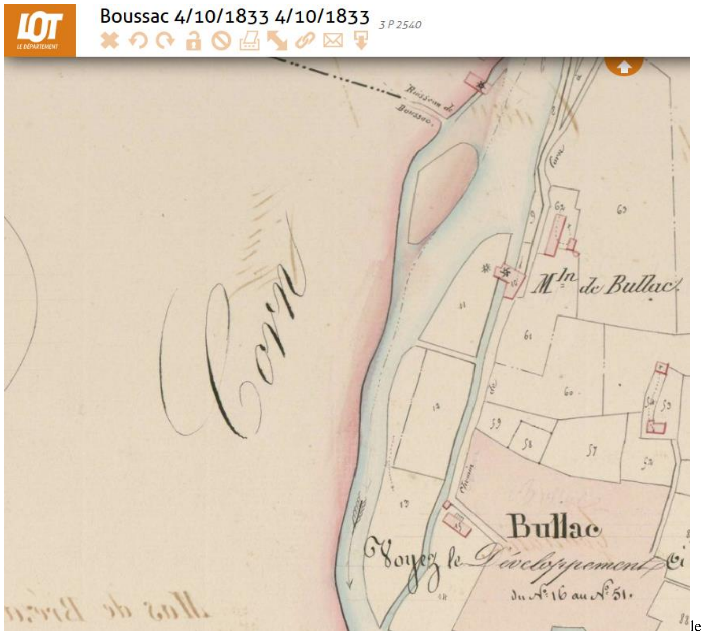
moulin de Bullac en 1833

Sur le plan établi en 1833, on note le dessin de deux meules sur le moulin de Bullac, parcelle n°10 de la section D. Cette parcelle appartient alors à Jacques Antoine Delpon et enfants à Livernon, propriétaire à Moulin de Bullac, de maison moulin en patus, 3 ares [possédant aussi les parcelles D 6, 11 (pâturage), 7, 8, 9 (B. peupliers)]. Revenu imposable : 33,12 Fr. (4)